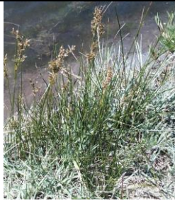
2 - Junco