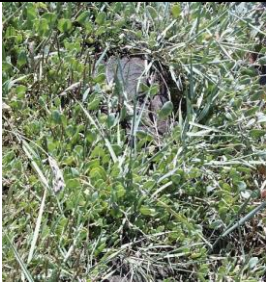
1- Gramata branca