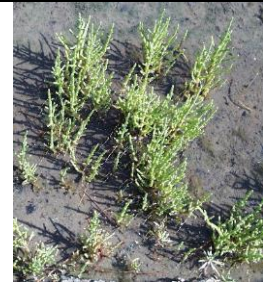
3 - Salicórnica